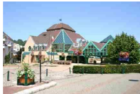
L'Hôtel de ville

Commune extrêmement dynamique d'un point de vue sportif et culturel, c'est l'Association Arts et Sports de Villebon qui organise les activités de plus de 1.600 adhérents. L'ASV, par l'intermédiaire de son président, soutient depuis le départ notre projet d'accueillir le 30 ème congrès de l'AFC en association avec la section aquariophile. Qu'il en soit ici vivement remercié!