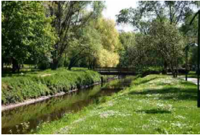
Promenade au bord de l'Yvette

Situé à l'extrémité de la vallée de Chevreuse, Villebon sur Yvette compte un peu moins de 10.000 habitants.